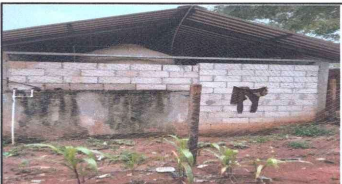
Foto 4: Se observa la cocina desde otro angulo de vista por lo que se necesita remozar.