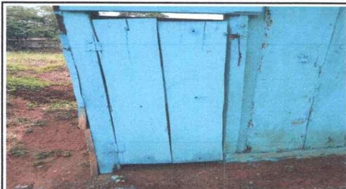
Foto 1: Se observa la necesidad de sustitución del forro del baño.