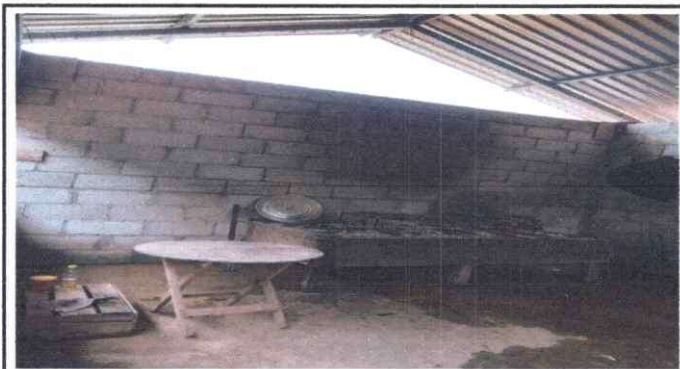
Foto 3: Se observa el polleton de la cocina en mal estado por lo que es necesario la sustitución.